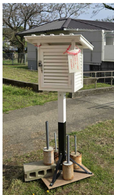
4年生では百葉箱についても学習します。

天気(晴れ・曇り・雨)によって1日の 気温の変化の仕方 に違いがあることを観察を通して学びます。4月24日(金)と27日(月)には8時から3時まで1時間ごとに気温調べをしました。班ごとに分担して行わせましたが、どの班も忘れることなく担当の時間に決められた場所に行き気温を測ることができました。(棒温度計を数本落として破損しましたが怪我はなかったのでよしとします。)子どもたちは気温が高い・低いに目が行きがちですが、 『変化の仕方』に注目させ、考えさせたいところです。 算数で学習する「折れ線グラフ」のよさにもここで気づかせたいです。