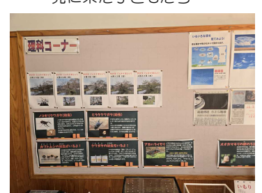
観音淵のサクラの写真や生き物の説明