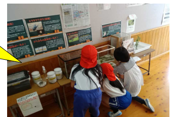
休み時間にアカハライモリを見に来た子どもたち

こうやって、まずは身近な生き物とふれあうことで、理科に興味をもってくれたらうれしいです。