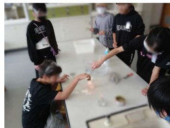
6年生。酸素の中に火のついたスチールウールを入れると…