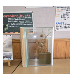
オオカマキリの卵のう