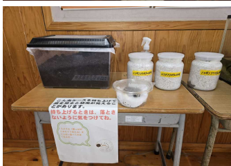
カブトムシの幼虫とクワガタムシの幼虫